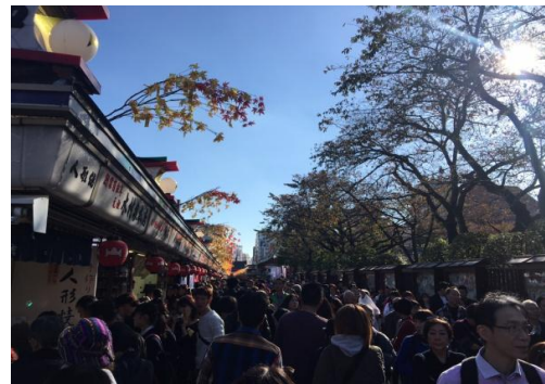
參訪團參觀淺草寺