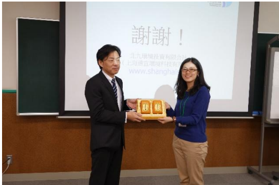
由商總代表參訪團給予北九環境投資有限公司紀念品