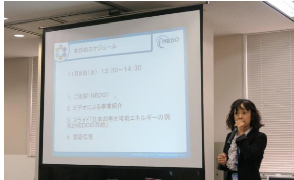
産業技術綜合開發機構(NEDO)説明日本國內 再生能源計畫現況與發展