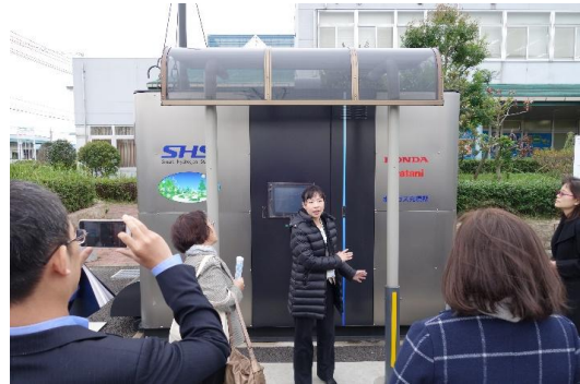
解說人員介紹氫氣加氣站的使用方式