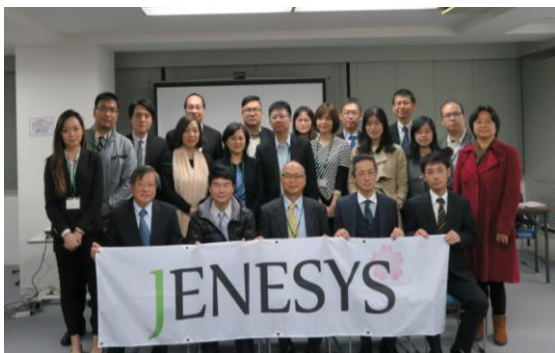
日本工商團體交流訪日團團員合照

參訪團於 11 月 12 日下午聯合舉行報告會及歡送會，就七天參訪內容用分組報告的方式輪流發表，會後交流餐會互動熱絡，並團體合照留念。