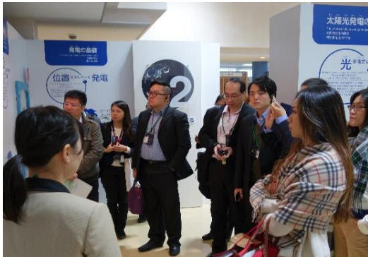
解說人員介紹北九州新能源的運用與開發現況