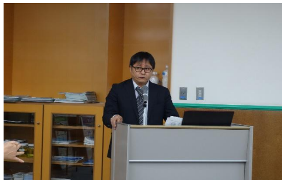
北武先生介紹北九州生態城並播放短片