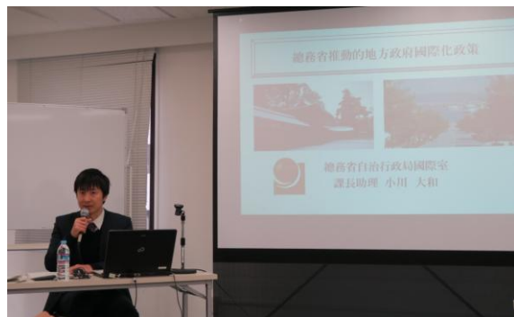
小川大和課長助理說明總務省推動的地方政府國際化政策