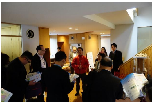
解說人員解說生態房子的功能與利用狀況