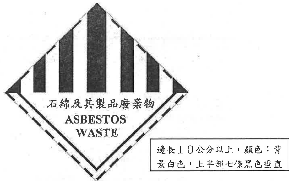
圖 2、有害事業廢棄物特性之標誌-石綿及其製品廢棄物

(三) 太空包外袋應標示事業名稱、廢棄物代碼 C-0701 (石綿及其製品廢棄物)、貯存日期、數量、成分及區別有害事業廢棄物特性標誌 (如圖 2)。