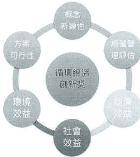
循環經濟創新獎構面