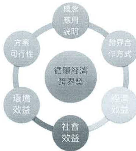
循環經濟跨界獎構面

跨產業領域合作與資源鏈結將對循環經濟有更高的貢獻。循環經濟跨界獎的頒發，希望能促使企業除自身落實循環經濟管理、產品設計外，不同產業類別（如鋼鐵業與資訊業、農業與物流業等跨製造與服務業別）、企業範疇外之合作夥伴間相互創造循環經濟鏈所帶來的效益，以及對供應鏈發揮影響激盪，更應鼓勵。