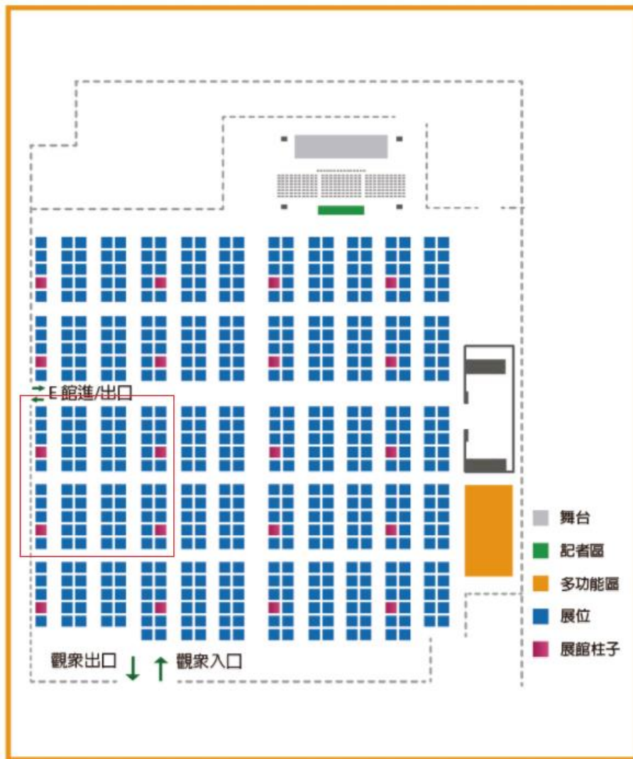
澳門威尼斯人金光會展D館