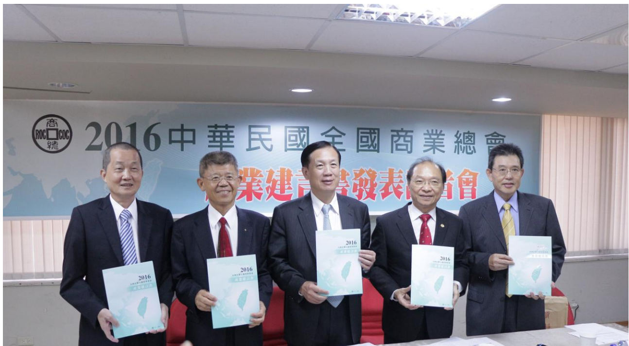
商總發表 2016 產業建言書