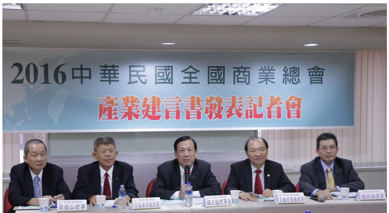
2016 產業建言書發表記者會現場 Q&A