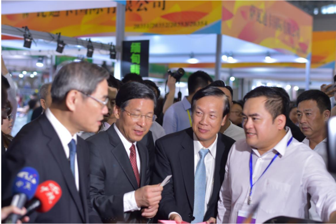
商總賴正鎰理事長與國台辦主任張志軍(左 1)、天津市長王東峰(左 2)展場巡禮